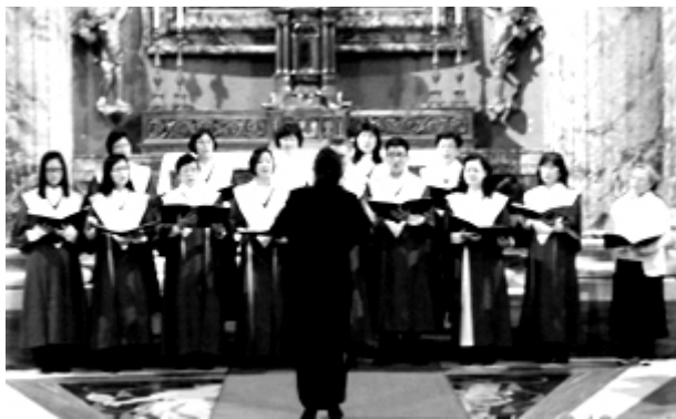
合唱团在教堂演唱

让我们大家一起努力吧！同时祈求圣神引领，并坚信天主才是我们的统帅，我们只不过是祂的工具。然后敢敢地说：“我在这里，我已准备好，请派遣我！”