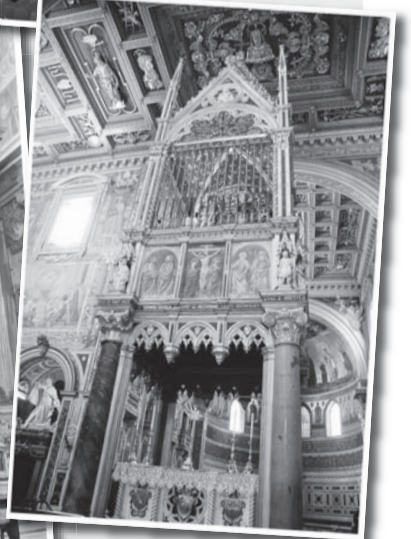
● 哥德式风格的祭台华盖的金属栏栅内珍藏着圣伯多禄及圣保禄的头骨圣髑。