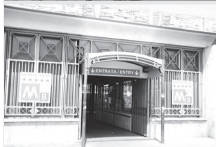
● 罗马市特米尼地铁站(Stazione di Roma Termini)的其中一个入口。特米尼地铁站是罗马市的主要铁路车站，欧洲最大的车站之一。