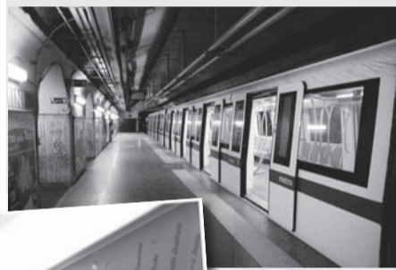
● 罗马地铁有两条路线：A线和B线 (Linea A & Linea B)

第三条路线 (C线) 和B线的支线 (B1) 的开通工程正在进行中。罗马地铁的系统规模较其他西欧大城市的地铁小，主因是考虑到建造过多的地铁会损坏罗马市内众多重要的历史遗迹。