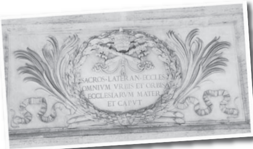
● 在大殿的入口处刻有拉丁文铭志：Sacrosancta Lateranensis Ecclesia Omnium Urbis et Orbis Ecclesiarum Mater et Caput译成英文就是Most Holy Lateran Church, of all the churches in the city and world, the mother and head; 意即“至圣的拉特朗大殿，全罗马及普世所有教堂的母亲及根基。”

根据教会历史记载，大殿前身为一座古老大宅，原属罗马著名的拉特朗家族所有，较后落入罗马帝国王后福斯达 (Fausta) 的手中。后来，君士坦丁皇帝把这产业捐赠给教宗米迪 (Melchides 311-314)。