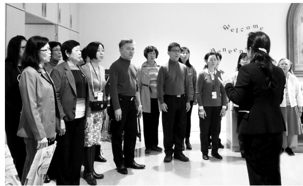
合唱团在FMM修院献唱

演唱当晚开始时的表现没有预期的好。可能因为时差的关系，加上教堂内好冷，开始的三首合唱