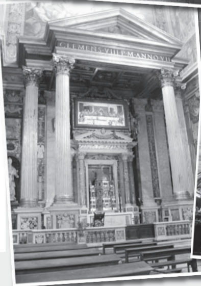
● 大殿的圣体龕，位于其上方；据说是当年耶稣举行最后晚餐时所用的桌子。